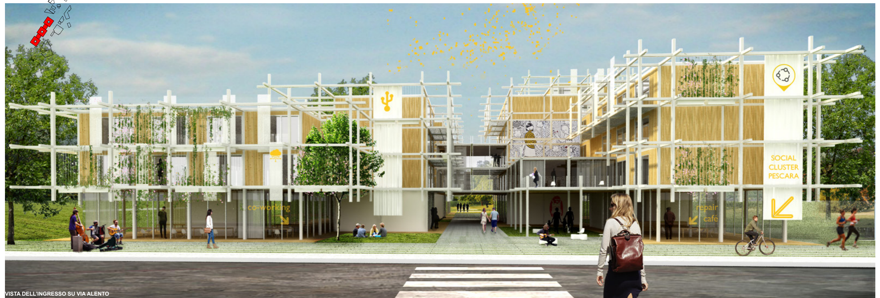
VISTA DELL'INGRESSO SU VIA ALENTO